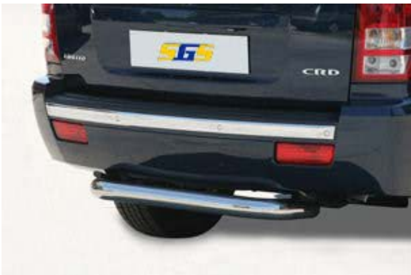
PP1/166/IX Heckrohr, mittig Ø 76mm, Edelstahl Nicht für Fahrzeuge mit Anhängezugvorrichtung