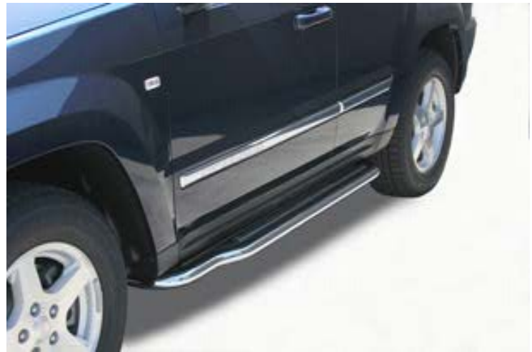
P/166/IX Trittbretter Ø 50mm, Edelstahl