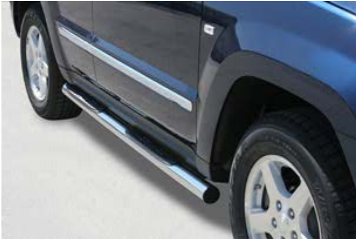
GP/166/IX Schwellerrohr mit Tritt Ø 76mm, Edelstahl