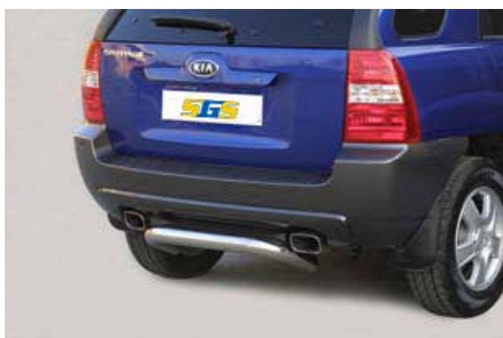
PP1/158/IX Heckstoßstange Ø 76mm, Edelstahl