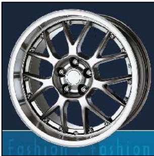
Typ 13 silber