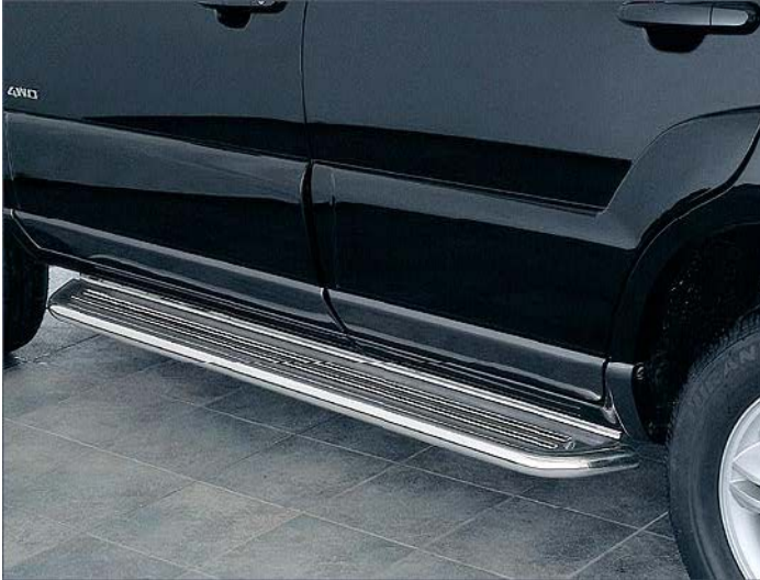
1334071 Trittbretter lang, Edelstahl