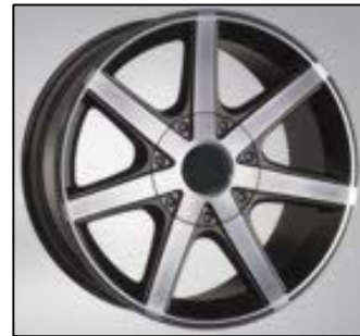
Typ 48 anthrazit