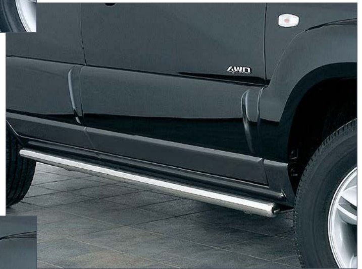
1334051 Flankenschutzrohr 51mm, Edelstahl