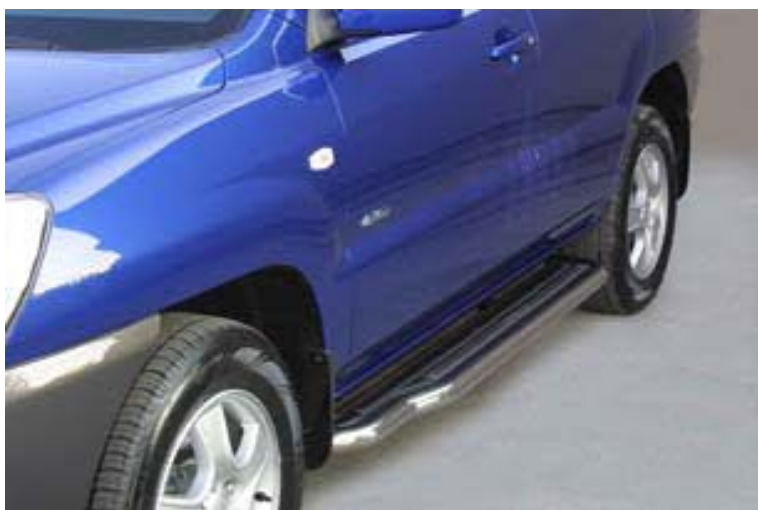
P/158/IX Trittbretter Ø 50mm, Edelstahl