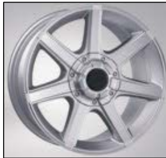
Typ 48 silber