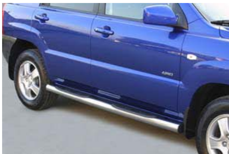
GP/158/IX Schwellerrohr mit Tritt Ø 76mm, Edelstahl