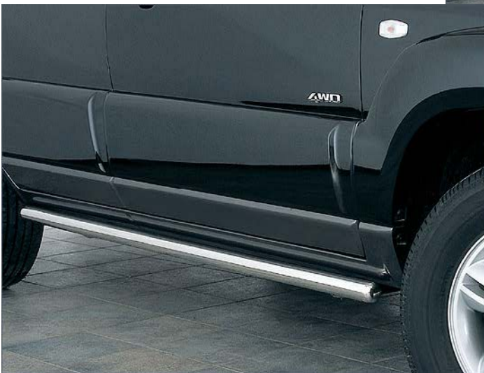
1334251 Flankenschutzrohr 60mm, Edelstahl