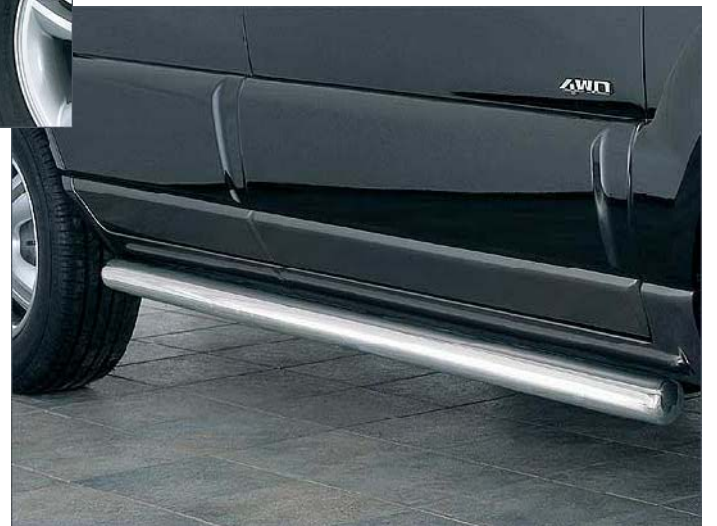
1334151 Flankenschutzrohr 76mm, Edelstahl