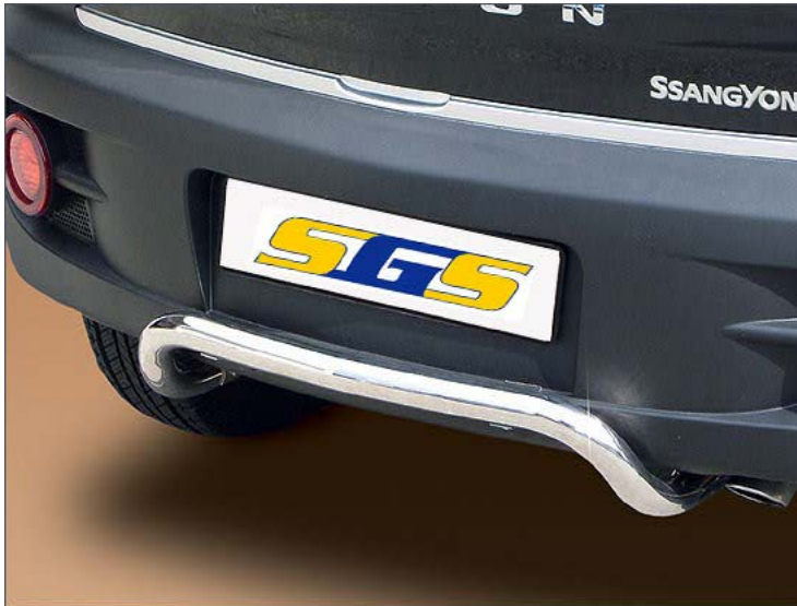
11L4038 Heckstoßstange Ø 51mm, Edelstahl nur für Coupe