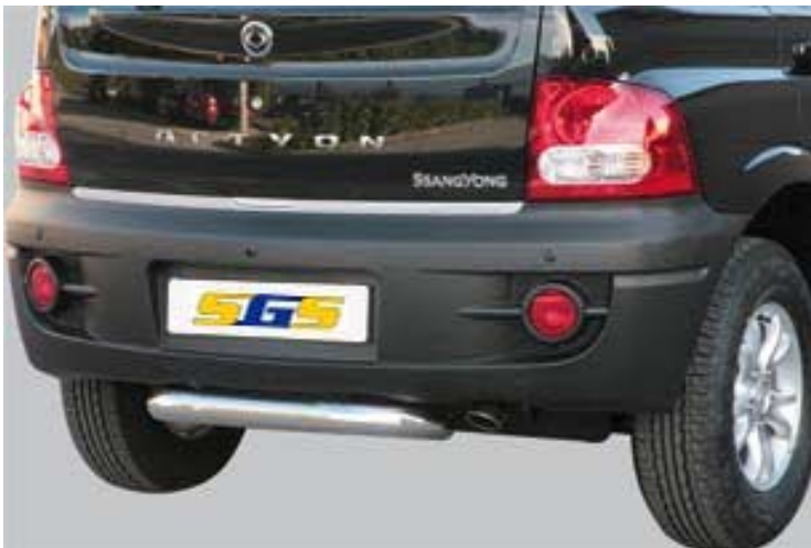
PP1/191/IX Heckrohr, Edelstahl