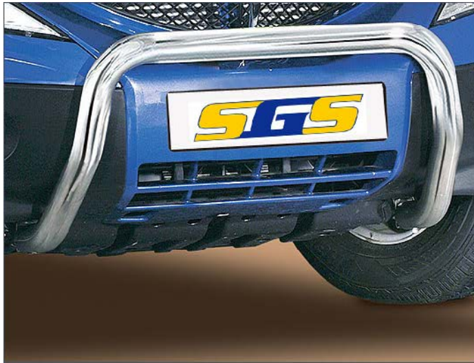
11L4013 EU-Personenschutzbügel Ø 60mm, Edelstahl nur in Verbindung mit 11L4014 oder 11L4041