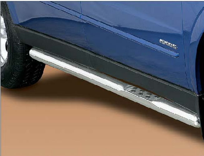
11L4150 Flankenschutzrohr mit Auftritt und Antirutschknoppen Ø 70mm, Edelstahl nur für Coupe