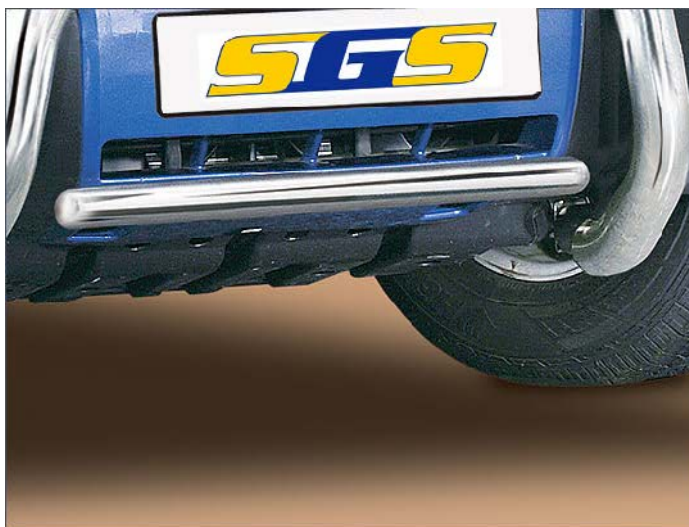
11L4041 EU-Querrohr Edelstahl nur in Verbindung mit 11L4013 oder 11L4041