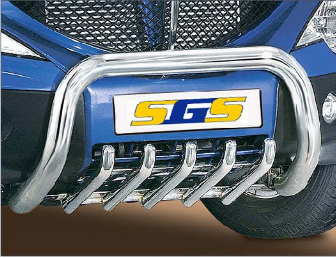
11L4113 EU-Personenschutzbügel Ø 70mm, Edelstahl nur in Verbindung mit 11L4014 oder 11L4113