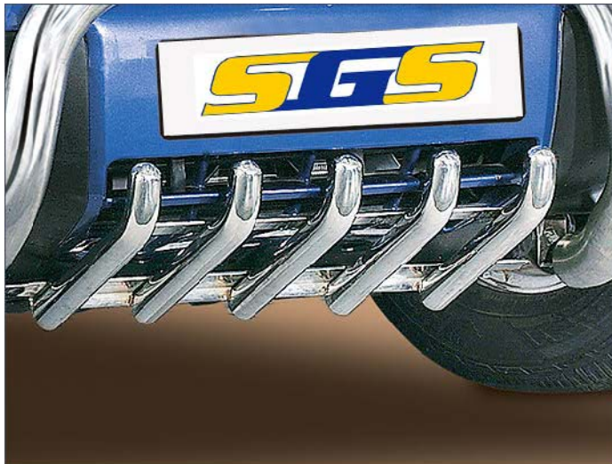
11L4014 EU-Unterfahrschutz Ø 60mm, Edelstahl nur in Verbindung mit 11L4013 oder 11L4113