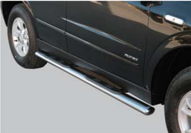
GP0/191/IX ovales Schwellerrohre Edelstahl