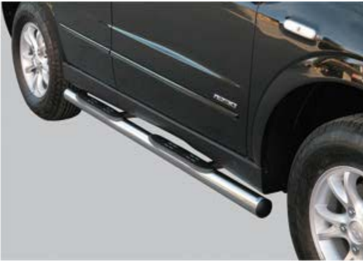
GP/191/IX Schwellerrohre mit Tritt Ø76mm, Edelstahl