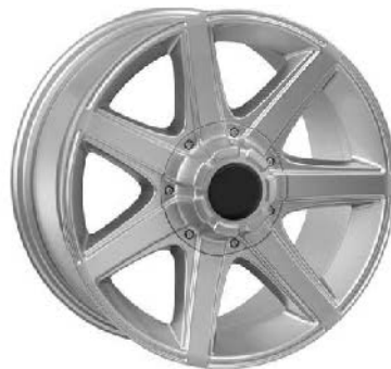
Typ 48 silber