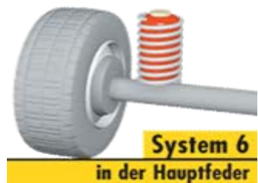
System 6 in der Hauptfeder

Ob harte oder weiche Federung, hohe oder niedrige Fahrzeughöhe, ganz nach Wunsch kann das Fahrzeug über die Veränderung des Luftdrucks an die Bedürfnisse des Fahrers angepasst werden; entweder während der Fahrt mit dem eingebauten Kompressor (Option) oder mit dem Reifenfüller bei einem Zwischenstopp an der Tankstelle