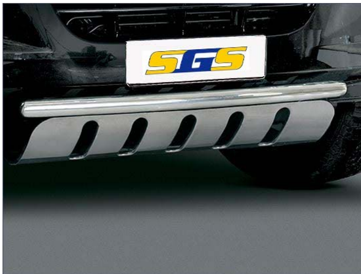
10T4014 EU-Unterfahrschutzplatte mit Querrohr, Edelstahl