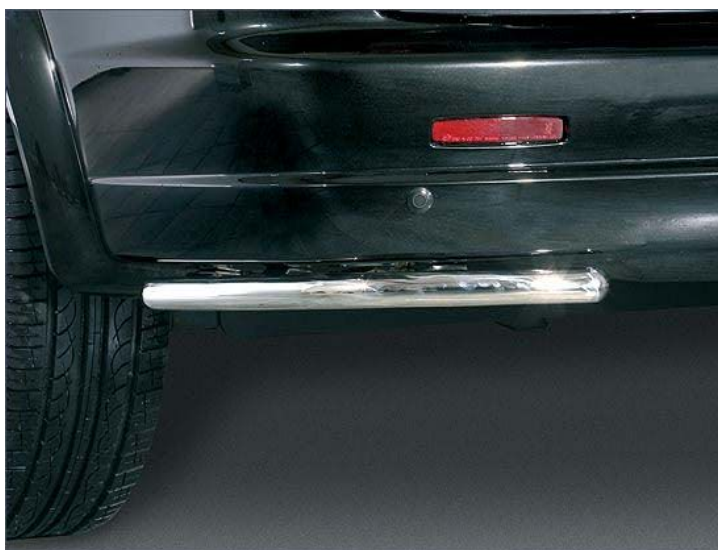
10T4034 Heckeckenschutzrohr Ø42mm, Edelstahl