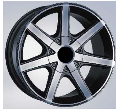
Typ 48 anthrazit