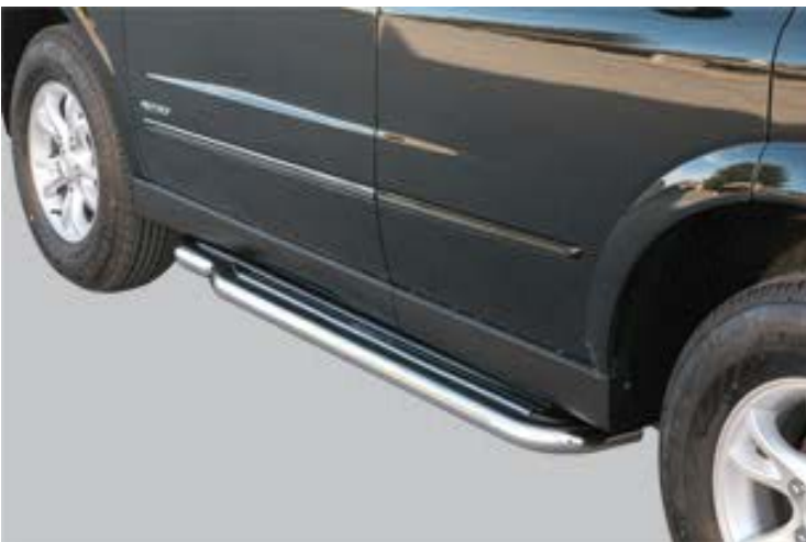
P/211/IX Trittbretter Ø50mm, Edelstahl