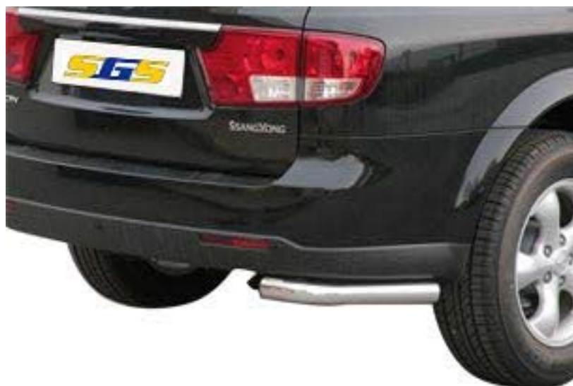
PPA/211/IX Heckeckenschutz Einzelrohr Ø63mm, Edelstahl