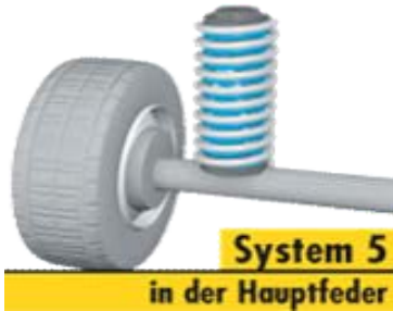
System 5 in der Hauptfeder

HV-234155 Niveaufedern SsangYong Kyron Bj. 09.2005- inkl. TÜV-Gutachten (Mindestladung 1000kg)