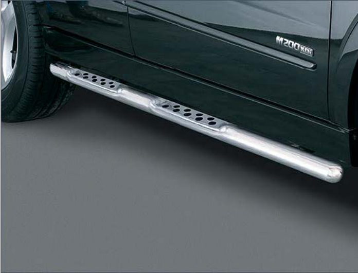
10T4251 Flankenschutzrohr mit Tritt und Antirutschknoppen Ø60mm, Edelstahl