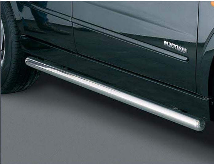
10T4051 Flankenschutzrohr Ø60mm, Edelstahl