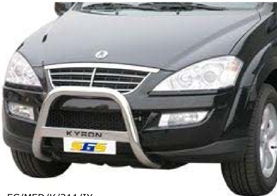
EC/MED/K/211/IX EU-Personenschutzbügel Ø63mm, Edelstahl