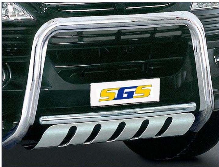
10T4013 EU-Personenschutzbügel Ø 60mm, Edelstahl