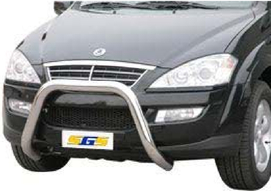
EC/SB/211/IX EU-Personenschutzbügel Ø76mm, Edelstahl