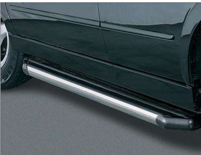
10T4071 Trittbrett, Edelstahl