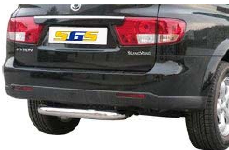
PP1/211/IX Heckrohr Ø76mm, Edelstahl