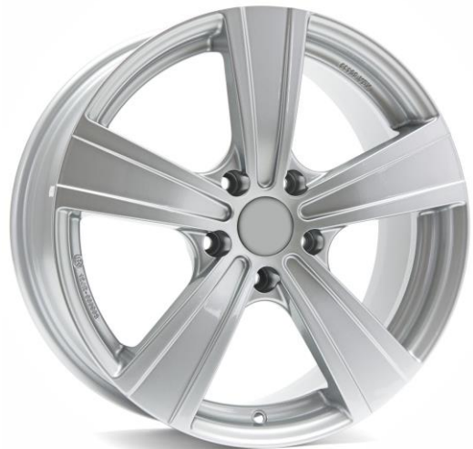
Typ MATTO silber lackiert