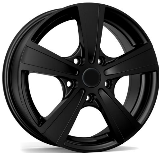
Typ MATTO schwarz lackiert