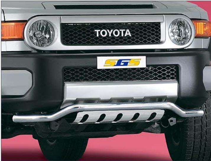
12L4017 EU-Spoilerschutzrohr gekröpft mit Unterfahrschutz Ø 51mm, Edelstahl