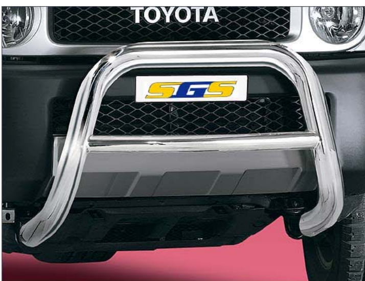
12L4113 EU-Personenschutzbügel Ø 70mm, Edelstahl mit integriertem Querrohr Ø51mm