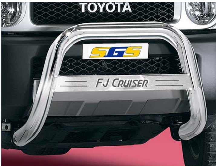
12L4013 EU-Personenschutzbügel Ø 76mm, Edelstahl