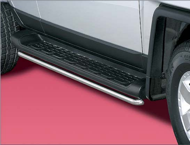
12L4075 Trittbrettschutzrohr Ø 42mm, Edelstahl