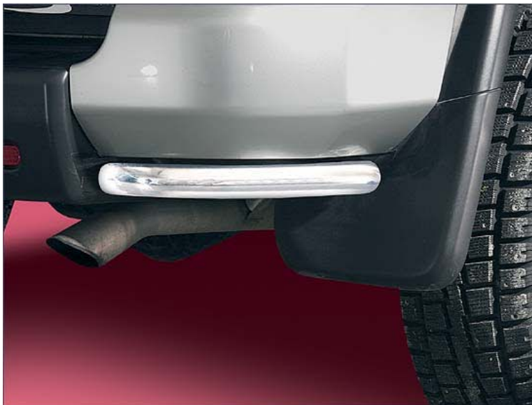
12L4033 Heckeckenschutz Ø 42mm, Edelstahl